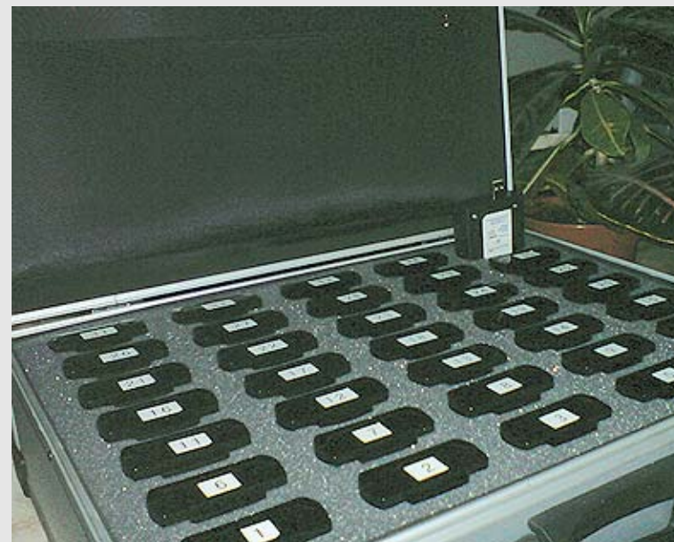
пултове за гласуване